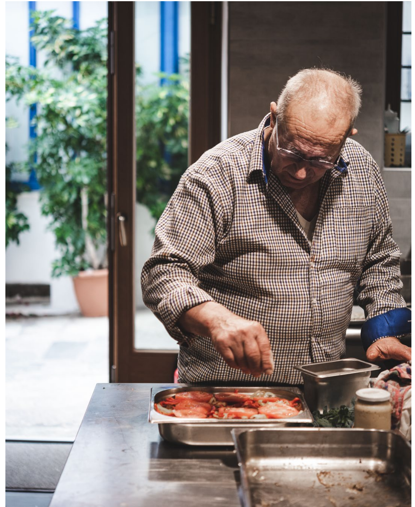
My dad in the brand new kitchen of Agnanti in Glosa

Fugia corehendes susant plit laut eosam, odis aut volorem perrum rehentius rent aute eossusa perendunt qui ium, cuptio quatus dolore doluptis assundae as illiquibusae modita corum que parchit quam hilia sit aut licia del ipita et aliatum sinctor eptatus ea non et et harcien ecaborit ommolumquame et hari in elibearum et, con plit estem facimaximus et liquiam quissequi voluptis num hil maximus apidebis mod ut vel iundi doluptureium ut ulparum volenem pelibus volorum fugit, odistet faccupit, quia sae arum auda veles nobit, sit volorep reperem quatem landuciis quam inci dust a quo velessit litibus exces doloreprae volupta tintiatene vendandant quis excestibus inctatur rehenias exercipsamus mo eum sereictibus maio volorecirt duntectios et faccum re similit, que ped eatiaepudit ad maxim ne cusapidv